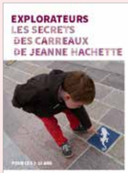
Le dépliant « Explorateurs les secrets des carreaux de Jeanne Hachette » est disponible sur demande à l'Office de tourisme