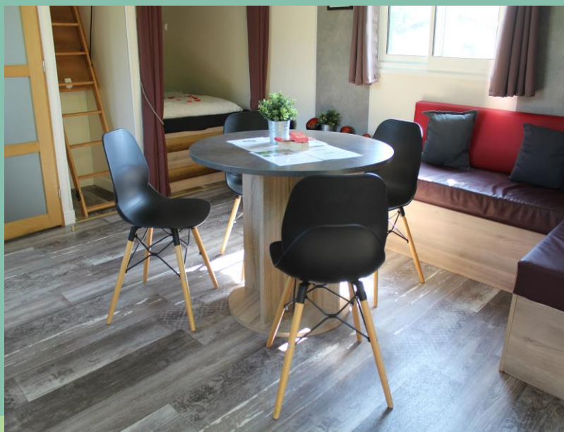
Le château mobile a été conçu de toutes pièces par José et Pascal

Le Camping de la Trye à Bresles vous propose un séjour combiné : location de canoë kayak avec une sortie en autonomie sur le Thérain. Une nuit calme en campagne picarde dans l'un des sept hébergements insolites du camping: tente woody safari, château mobile, tiny house, coco rigolo, tipi sur pilotis, tipi Davy Crockett, chalet et bungalow avec spa.